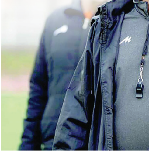
از اینها عمل کند.

بلا تکلیف بودند. هیچ مربی در دنیا نمی‌تواند در مسابقه‌ای مهم در حالی به موفقیت فکر کند که در جای دیگر، کفرش مشغول باشد. اینکه هست و ادامه می‌دهد یا نیست! این خیلی بد است. شاید ظاهر بوماد در باطن نبود! هر مربی هم که باشد وقتی مدیری حرف می‌زند احساس می‌کند که این حرف‌ها در راستای ابقای او است یا رفتنش، این بد است! در آستانه مسابقات مهمی مثل لیگ نخبگان آسیا با این سیاست کل مجموعه از لحاظ روحی و روانی به هم ریختند. ما هم به عنوان یک پیشکسوت وقتی در جمع بچه‌ها قرار