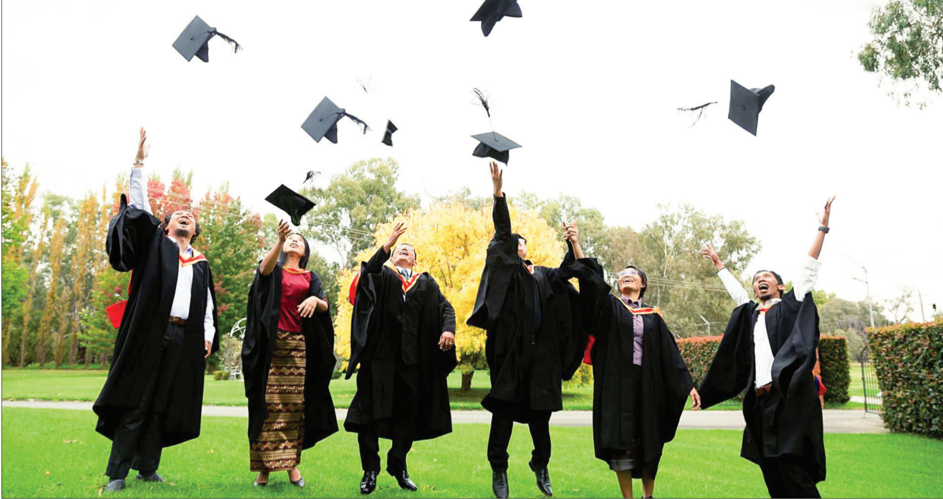
بخش چهل و سوم