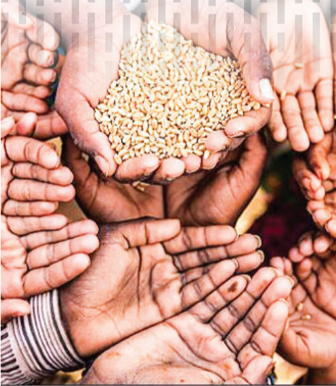
دست‌های کودکان در حال نگه‌داشتن دانه‌های گندم