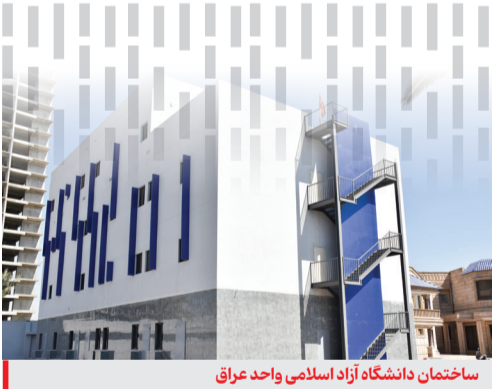
ساختمان دانشگاه آزاد اسلامی واحد عراق

خبری مبنی بر برگزاری نمایشگاه عصر امید در واحد عراق هم مطرح شده است. در خصوص این رویداد و زمان برگزاری آن توضیح دهید. بله، این مورد هم در دستورکار قرار دارد و فکر می‌کنم در فصل زمستان برگزار شود. نمایشگاه عصر امید واحد عراق در حوزه عرضه خدمات و محصولات دانش‌بنیان دانشگاه آزاد است، به عبارت بهتر محصولات و خدماتی که قابلیت صادرات و عرضه به عراق را دارند.