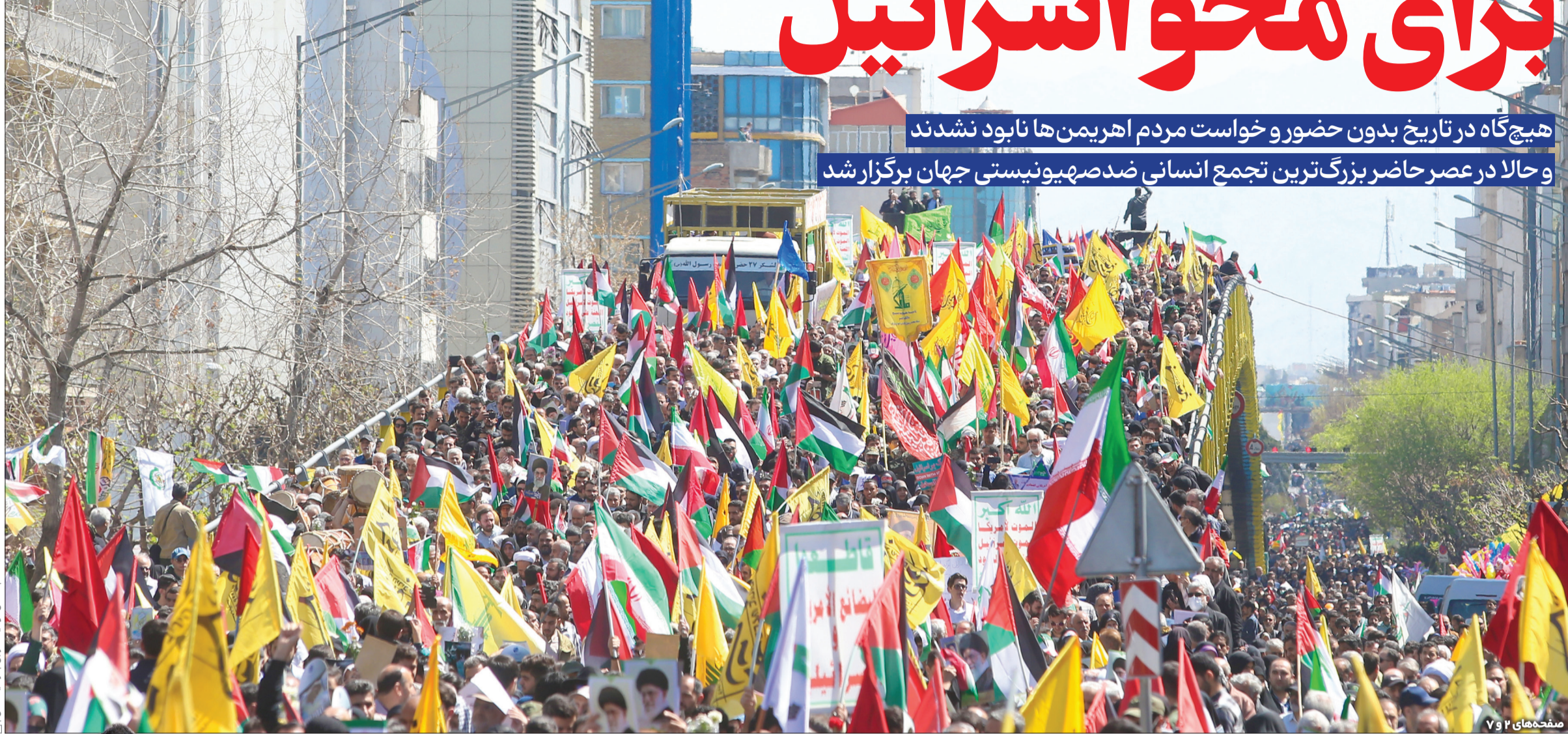
صفحه‌های ۲ و ۷

دیدارهای رضانی رهبر انقلاب با دانشجویان در سال‌های گذشته نکات راهبردی مهمی داشته است سوال‌های مهم پیرسید جواب‌های تاریخی بگیرید