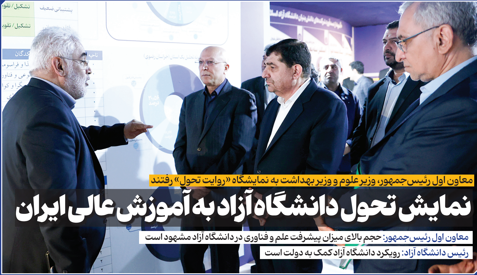
معاون اول رئیس جمهور، وزیر علوم و وزیر بهداشت به نمایشگاه «روایت تحول» رفتند