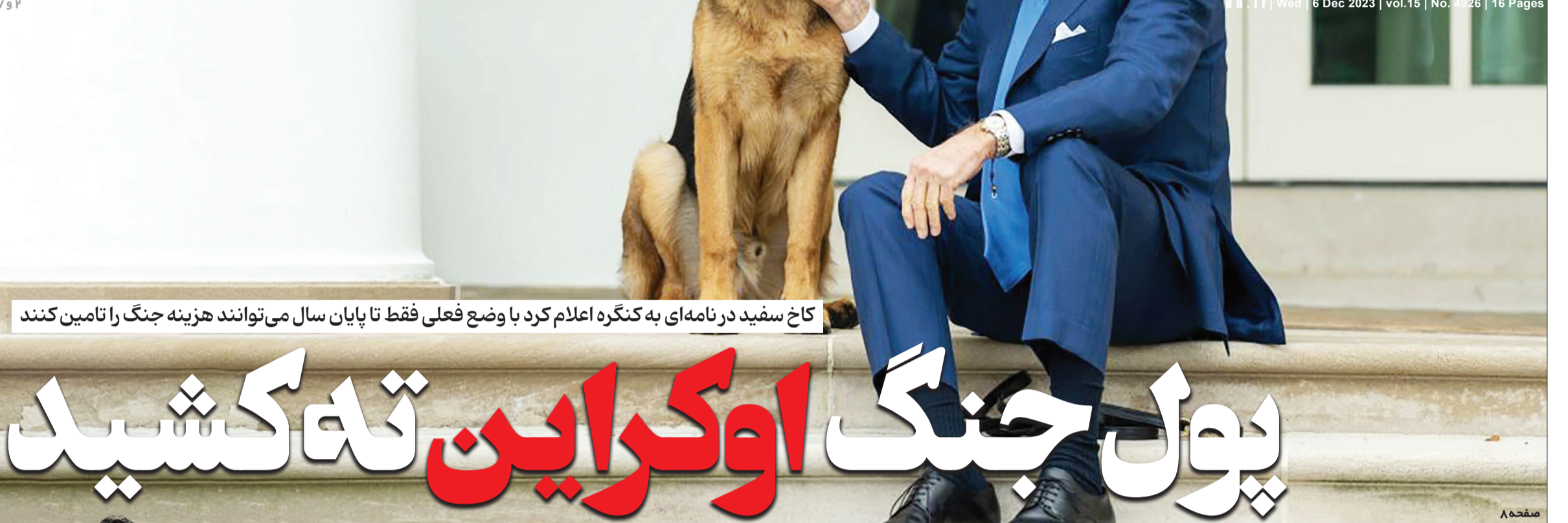
کاخ سفید در نامه ای به کنگره اعلام کرد با وضع فعلی فقط تا پایان سال می توانند هزینه جنگ را تامین کنند

Wed 6 Dec 2023 | vol.15 | No. 4026 | 16 Pages