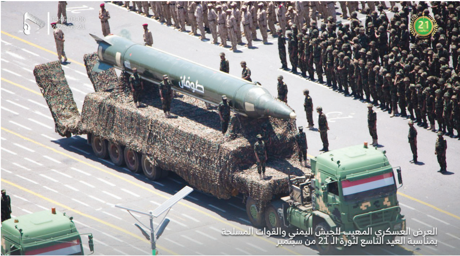
العرض العسكري المهيب للجيش الیمنی والقوات المسلحة بمناسبة العيد التاسع لثورة ال 21 من سبتمبر

این دو حوزه را همچنین می‌توان به دو بخش دور (فلسطین اشغالی) و نزدیک (خارج از فلسطین اشغالی) تقسیم کرد. یمنی‌ها در بخش دور، به خود رژیم صهیونیستی حمله می‌کنند و در بخش نزدیک منافع آن را در دریای سرخ و دریای عرب هدف می‌گیرند. در حملات یمن به فلسطین اشغالی آنچه اهمیت دارد فاصله زیاد است. این فاصله زیاد نیازمند به‌کارگیری سلاح‌های دوربرد است که کمتر کشوری از آنها برخوردار است. نزدیک‌ترین فاصله میان این دو سرزمین نقاط مرزی استان صعده در شمال یمن تا بندر ایلات در جنوبی‌ترین نقطه فلسطین اشغالی است.