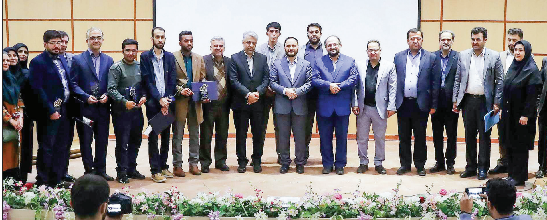
رئیس نهاد نمایندگی مقام معظم رهبری در دانشگاه ها: