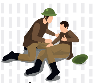
تعداد زخمی های قطعی