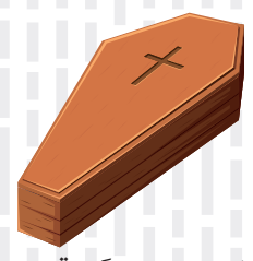
تلفات کشته شدگان قطعی