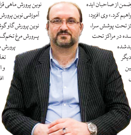
ورامین- پیشوا خواهند بود.

اینکه یک دستگاه تصمیم‌گیر در مواردی دچار اشتباه شود امری بدیهی و غیرقابل اجتناب است اما اگر موارد این اشتباهات زیاد شده و هیچ مشورتی نیز برای اصلاح رویه پذیرفته نشود امری کاملاً مذموم است. مجمع تشخیص مصلحت نظام در چندماه اخیر تصمیمات بحث‌برانگیزی اتخاذ کرده و باعث شده انتقادات زیادی در مورد عملکرد این نهاد شکل بگیرد. مخالفت با طرح واردات خودروهای آکرکرده در شرایطی که تنظیم بازار نیاز به تصویب آن دارد یا مخالفت با طرح تناسی شدن انتخابات در شرایطی که اکثر طرح به افزایش مشارکت و بالاتر رفتن عیار نمایندگان انتخاب شده کمک می‌کند، نمونه‌های از اقدامات مجمع است که کمتر استدلال منطقی‌ای برای آنها توسط اعضای مجمع ارائه شده است. شاید بشود این تصمیمات را با استناد به دفاعیه رئیس مجمع این‌گونه توجیه کرد: «اینکه کار هیات عالی نظارت ممکن است دارای نقص باشد طبیعی است، در کار هر نهاد دیگری هم نقص وجود دارد. حتی اینکه یک نماینده بگوید من نظرات مجمع هیات عالی نظارت را قبول ندارم، اشکالی ندارد. اما تعطل و مخالفت مجمع در بررسی طرح «الزام به ثبت رسمی معاملات اموال غیرمنقول» در شرایطی که رهبر انقلاب تصویب آن را مصلحتی ضروری توصیف کرده‌اند به هیچ عنوان توجیه‌پذیر نیست.