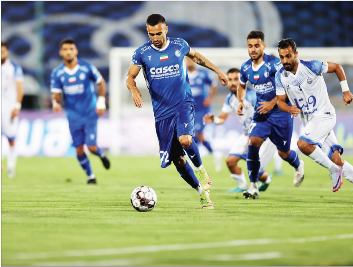
احتمال تعویق دیدارهای استقلال تا پایان بازی‌های آسیایی