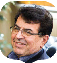
عضو هیات علمی دانشگاه شاهد

او در پاسخ به این سوال که آیا این نظام می‌تواند برای دانشگاه‌های