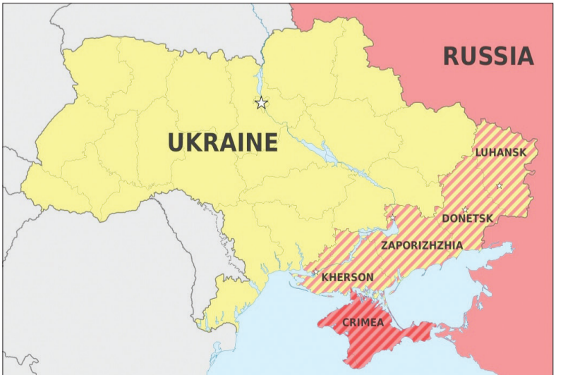
استان‌های اوکراینی که روسیه به خاک خود ملحق کرده است منطبق بر سناریوی حداکثری (۶۲ درصد خاک اوکراین)