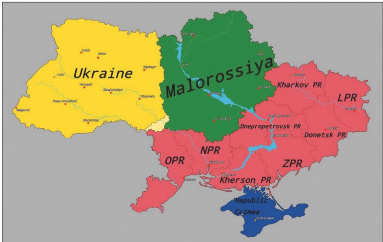
قرمز و آبی: نوروسیا منطبق بر سناریوی میانی (۴۲ درصد خاک اوکراین) قرمز، آبی و سبز: نوروسیا و مالوروسیا (۴۶ درصد خاک اوکراین) منطبق بر سناریوی حداکثری (۶۸ درصد خاک اوکراین)