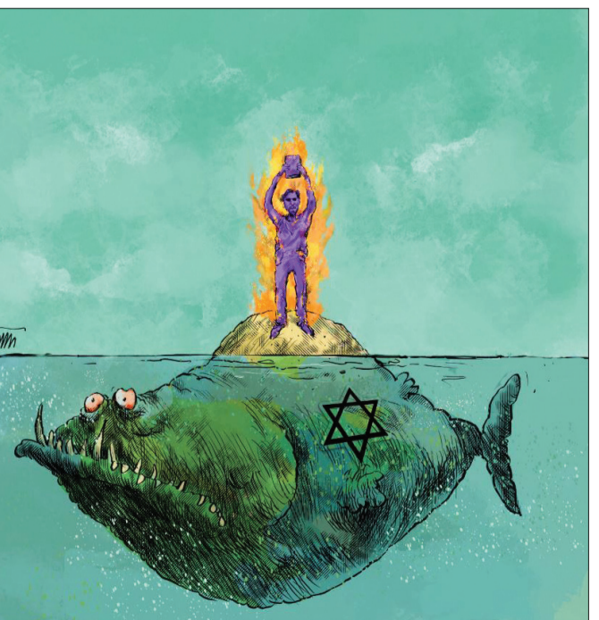
سید مسعود شجاعی طباطبایی