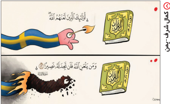
کمال شریف - یمن