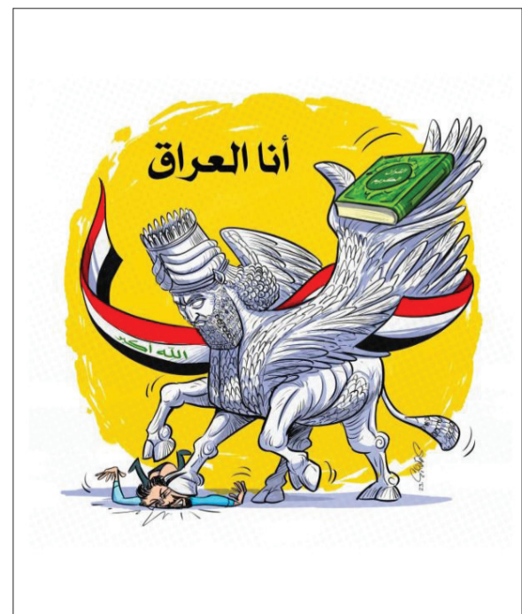
عمر الجارح - عراق