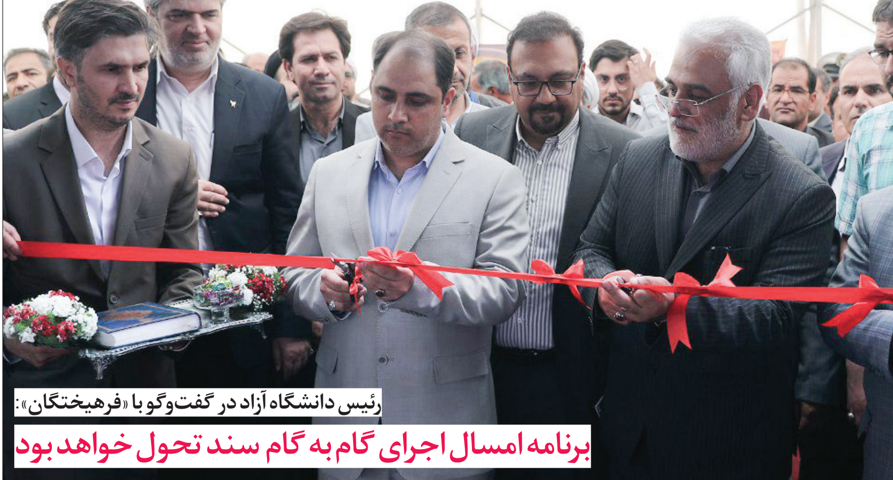
رئیس دانشگاه آزاد در گفت‌وگو با «فرهیختگان»:

سومین رویداد عصر امید روز گذشته در واحد سیرجان آغاز شد