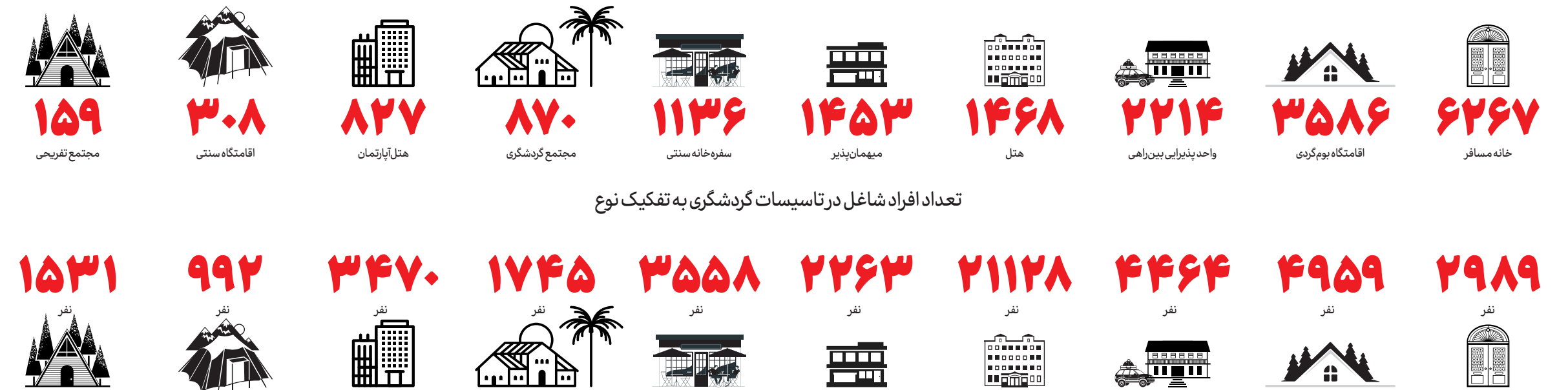
تعداد افراد شاغل در تاسیسات گردشگری به تفکیک نوع

کمی لجه شیرازی‌اش را غلیظ‌تر می‌کند و در ادامه می‌گوید: «کم پیش می‌آید اسنپ کار کنم. کار دولتی است اما این چند روزی که شیراز شلوغ است و اداره هم تعطیل، ترجیح دادم در خانه نمانم و چند سرویس اسنپ کار کنم.» به مقصد می‌رسیم. خدا به شما برکت بدهد و همیشه شهرمان شلوغ باشد.» یکی از دوستان شیرازی‌ام در آخر در پاسخ به او این را می‌گوید.