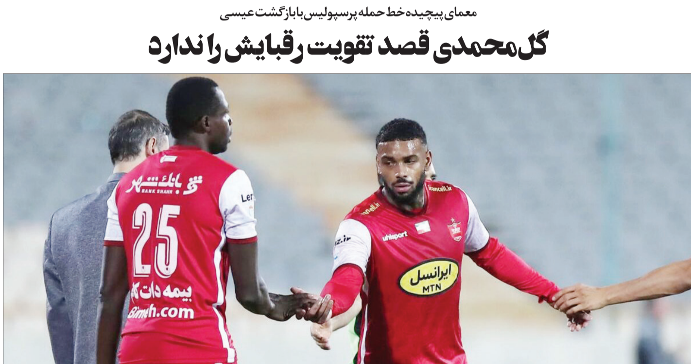
معمای پیچیده خط حمله پرسپولیس با بازگشت عیسی

لیگ قهرمانی در کار نیست از آنجا که قرار نیست لیگ قهرمانان در این فصل برگزار شود، پرسپولیس فقط در رقابت های داخلی شرکت خواهد داشت. با توجه به همین مساله یحیی بعید است تیمش بیشتر از ۴ مهاجم نیاز داشته باشد. با این حساب احتمال اینکه او با جدایی یکی از آنها موافقت کند زیاد است. البته غیر از دو مهاجم خارجی و آل کثیر که خواهان بازگشت او شده است.