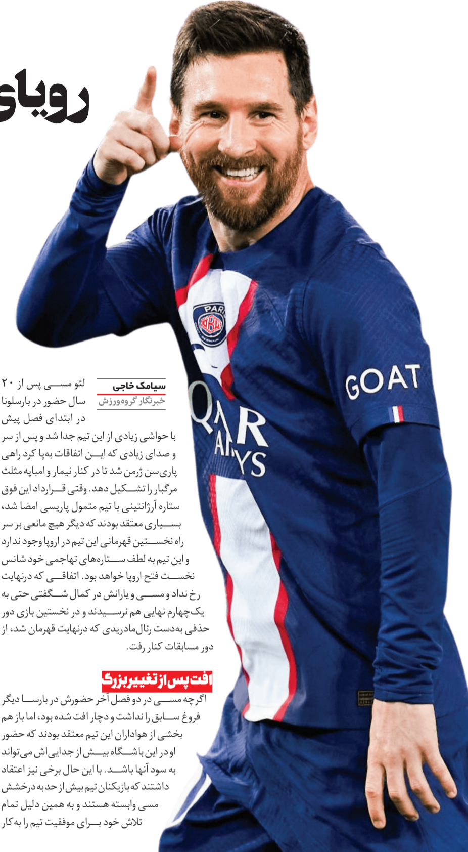
سیامک حاجی خبرنگار گروه ورزش

لئو مسی پس از ۲۰ سال حضور در بارسلونا در ابتدای فصل پیش با حواشی زیادی از این تیم جدا شد و پس از سر و صدای زیادی که این اتفاقات به پا کرد راهی پاری سن ژرمن شد تا در کنار نیمار و امپایه مثلث مرگبار را تشکیل دهد. وقتی قرارداد این فوق ستاره آرژانتینی با تیم متمول پاریسی امضا شد، بسیاری معتقد بودند که دیگر هیچ مانعی بر سر راه نخستین قهرمانی این تیم در اروپا وجود ندارد و این تیم به لطف ستاره های تهاجمی خود شانس نخست فتح اروپا خواهد بود. اتفاقی که در نهایت رخ نداد و مسی و یاراناش در کمال شگفتی حتی به یک چهارم نهایی هم نرسیدند و در نخستین بازی دور حذفی به دست رئال مادریدی که در نهایت قهرمان شد، از دور مسابقات کنار رفت.