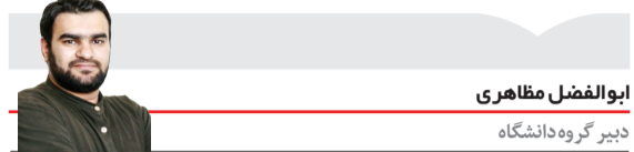
ابوالفضل مفا ره