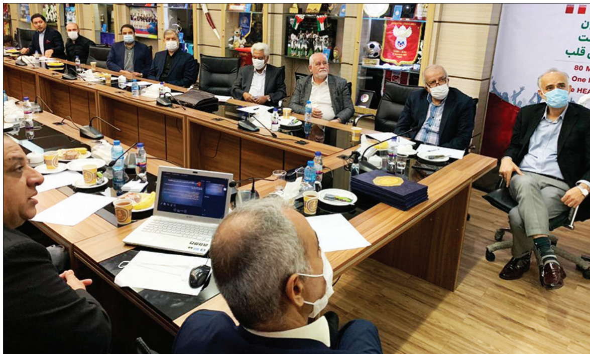
سرنوشت نمایندگان ایران در آسیا هنوز مشخص نیست

در واقع براساس بند ۲ از ماده ۵۸ اساسنامه فدراسیون فوتبال، اعضای کمیته