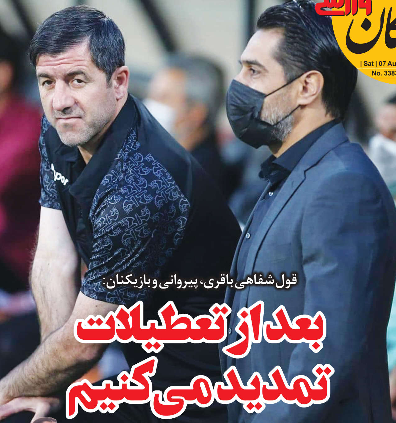
قول شفاهی باقری، پیروانی و بازیکنان: