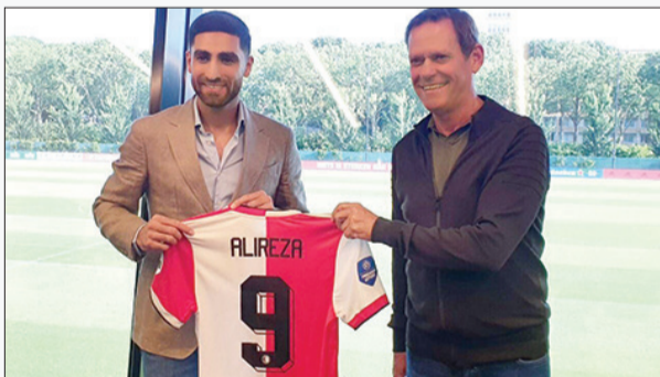
جهانبخش بعد از امضای قرارداد ۳ ساله با فاینورد

در لیگ برتر جزیره معمولاً بازیکنانی که شانس بازی در ترکیب اصلی را پیدا نکنند خیلی زود یا قرض داده می‌شوند یا به باشگاه دیگری فروخته؛ اما در مورد جهانبخش این اتفاق رخ نداد و این ملی‌پوش ایرانی سه فصل در برایتون ماندگار شد. اوون درباره دلایل این اتفاق چنین می‌گوید: «اومی گفت که در تیم‌های هلندی اش نیز هیچ‌گاه فوراً به موفقیت نرسیده و پله‌پله پیشرفت کرده است. به همین دلیل امید داشت در انگلیس نیز همین روند را داشته باشد و در فصل دوم با سوم بتواند به یک بازیکن تأثیرگذار و ثابت در ترکیب تیمش تبدیل شود. او در پایان نخستین فصل حضورش در این باشگاه این حرف‌ها را به من زد. اطمینان داشت که اوضاعش در تیم بهتری می‌شود و البته هیچ‌گاه از اینکه نتوانسته در نخستین فصل حضورش گلزنی کند، ناامید نشده بود.»