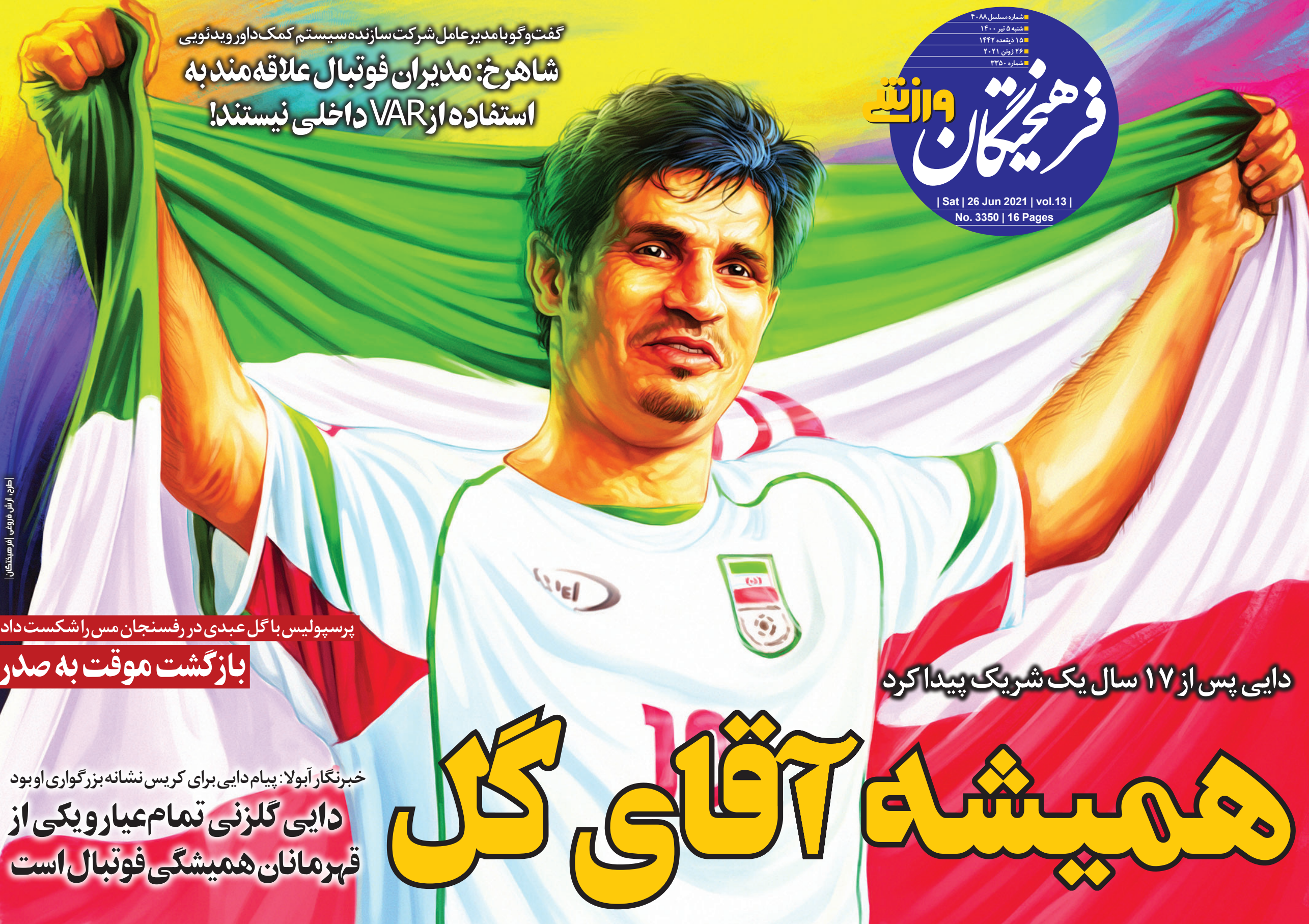
طرح: فرش فروری آرمیختگان

گفت و گو با مدیرعامل شرکت سازنده سیستم کمک داور ویدئویی شاهرخ: مدیران فوتبال علاقه مند به استفاده از VAR داخلی نیستند!