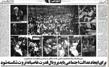
برای ایجاد عدالت اجتماعی باید پر و بال قدرت غاصبانه ثروت شکسته شود تا مترقین نتوانند در تصمیم‌گیری‌ها دخالت و جریان را به نفع خود تمام کنند

حجت‌الاسلام هاشمی‌فسنجانی سوم اردیبهشت ۶۲ در سلسله خطبه‌های عدالت اجتماعی خود در نماز جمعه تهران گفت: «در این بحث صحبت از شکستن قدرت سرمایه‌هاست و توجه به منزلت انسان و معیارهای اساسی انسانیت. در جوامع سرمایه‌داری و در جوامعی که دچار تبعیض اقتصادی هستند در آنجا اقلیتی ثروتمند هستند و اکثریتی محروم، عملاً کار به اینجایی رسد که بخش محروم جامعه از دخالت در سرنوشت اجتماع‌ها بی‌ماند و طبقه مرفه‌تر و ثروتمند هستند که سرنوشت‌سازنده، تصمیم‌گیر و دولت‌سازنده‌ها و قانونگذار و مدیر هستند و در جامعه‌ای که با این معیار مقامات و پست‌ها و مسئولیت‌ها تقسیم شده باشد کاملاً طبیعی است که طبقه مرفه و ممتاز تحمیلی از قوانین و اجراییات همیشه به نفع خودش استفاده کند. باید ببینیم اسلام برای این مشکل اساسی چه کرده است، چه فکری کرده که این حالتی که امروز در دنیا هست، هم در جوامع سرمایه‌داری است و هم در جوامع سوسیالیستی، منتهای دسترس سوسیالیسم آن ملا و مترقین سیاسی و شخصیت‌های گندم‌شده حزبی این نقش را ایفا می کنند و در جوامع سرمایه‌داری این شرکت‌ها، کارتل‌ها و سرمایه‌داران بزرگ هستند که همه چیز را مستقیم و غیرمستقیم کنترل خودشان می کنند. در تاریخ انبیا می بینیم که هر جا که قرآن تاریخ مبارزات و درگیری‌های انبیا را مطرح کرده آغاز، طبقه محروم و توده مردم در مقابل یک عده به نام مستکبر یا سرفراز یا ملا یا مترقی قرار گرفته‌اند. این راه‌ها جامی بینیم. از بعضی آیات قرآن هم معلوم می‌شود که همه انبیا مایه‌دون استثناء وقتی که برنامه خود را آغاز کردند مواجه شدند با کارشکنی و مخالفت