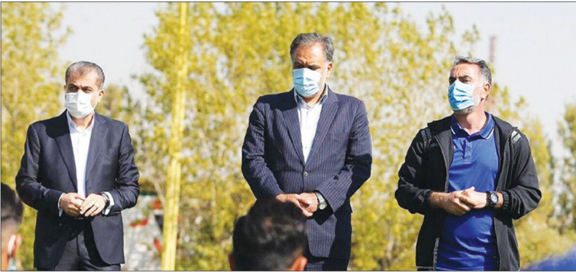
بیانیه‌های باشگاه استقلال با تاریخ انقضای دوازده‌روزه!

همه اینها درحالی است که همان‌طور که قبلاً نوشتیم بند فسخ عده قابل توجهی از بازیکنان استقلال فعال شده و اگر پرداختی جدیدی طی روزهای آینده توسط این باشگاه صورت‌نگیرد مطمئناً اتفاقات جالبی در انتظار استقلال نخواهد بود. همه اینها درحالی است که با تصمیم سازمان لیگ دیدارهای هفته شانزدهم لیگ برتر با تعویق مواجه شده و مطمئناً این موضوع به سود استقلال خواهد بود چرا که این‌سخت‌ترین تیم می‌تواند در فاصله پیش‌رو، زمان لازم را برای برطرف کردن نقاط ضعف و پوشاندن حواشی در راستای اقدامات یا تغییرات فنی داشته باشد و در این فاصله کارهای مناسبی انجام دهد.