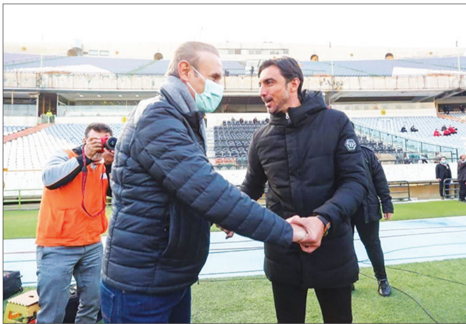
سخنگوی شهر خودرو در گفت‌وگو با «فرهیختگان»: مجبوریم پرونده را به AFC ببریم

درخصوص این پرونده شنیده می‌شود که احتمالاً حکم این بازیکن حدود ۲ تا ۳ ماه دیگر صادر شود و در آن زمان محرومیت آل‌کثیر به پایان رسیده است. اما از گوشه و کنار شنیده می‌شود که اگر سرخ‌ها به این پرونده در CAS معترض نمی‌شدند، به‌دلیل حضور این بازیکن در اردوی شب قبل از یکی از بازی‌های پرسپولیس، این امکان وجود داشت که محرومیت آل‌کثیر تشدید شود و پرسپولیس‌ها با بردن این پرونده به دیوان عدالت ورزش، از این محرومیت بیشتر جلوگیری کردند.