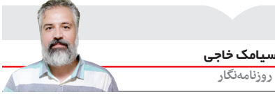
سیامک حاجی روزنامه‌نگار

درگیری دو هم‌تیمی سابق در دربی حساس میلان یکی از مهم‌ترین اتفاقات این دیدار مهم در جام حذفی ایتالیا بود که درنهایت با اخراج زلاتان ابراهیموویچ و شکست روسونری همراه بود. روملو لوکاکو و زلاتان، مهاجمان دو تیم در اواخر نیمه نخست با هم درگیر شدند که داور بازی به هر دوی آنها کارت زرد نشان داد. جدل این دو بازیکن حتی به توتل ورزشگاه هم کشیده شد و با شروع نیمه دوم زلاتان که تک گل میلان در نیمه نخست را به ثمر رسانده بود کارت زرد دوم را هم گرفت و از بازی اخراج شد تا اینتر از این فرصت استفاده کرده و درنهایت با زدن دو گل راهی مرحله بعد این مسابقات شود.