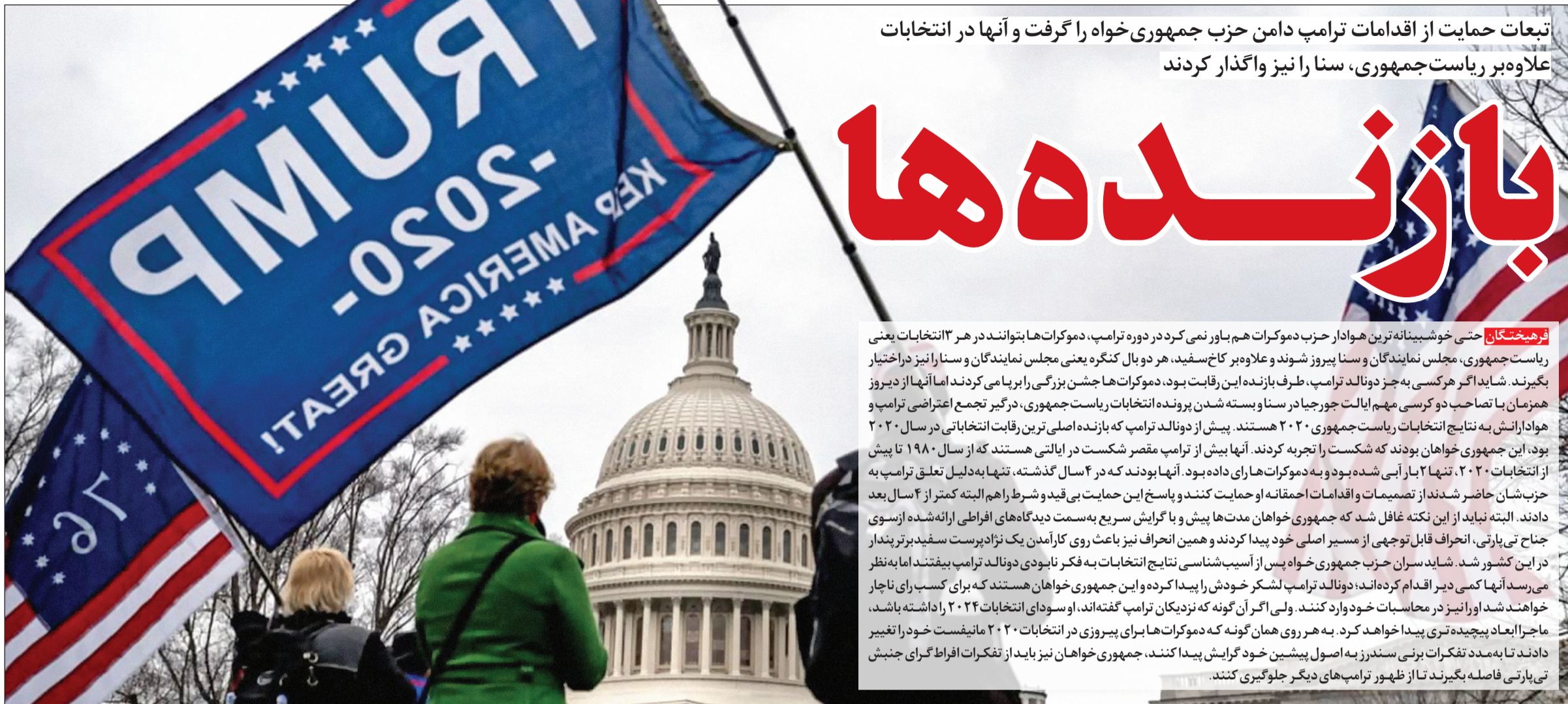
تبعات حمایت از اقدامات ترامپ دامن حزب جمهوری خواه را گرفت و آنها در انتخابات علاوه بر ریاست جمهوری، سنا را نیز واگذار کردند