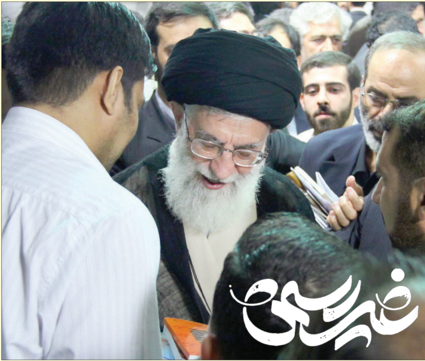
ادامه از صفحه ۱۲