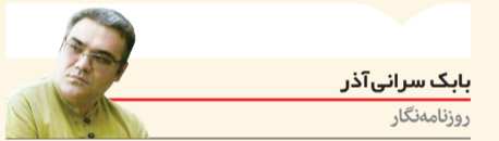
بابک سیرانی آذر