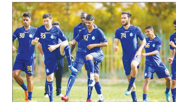
این کاهش عددها تا حدی در آپشن‌های بعدی لحاظ شده جبران خواهد شد تا به این ترتیب این غائله ختم به خیر شود.

انتخاب مدیرعامل فعلا در اولویت هیات مدیره نیست