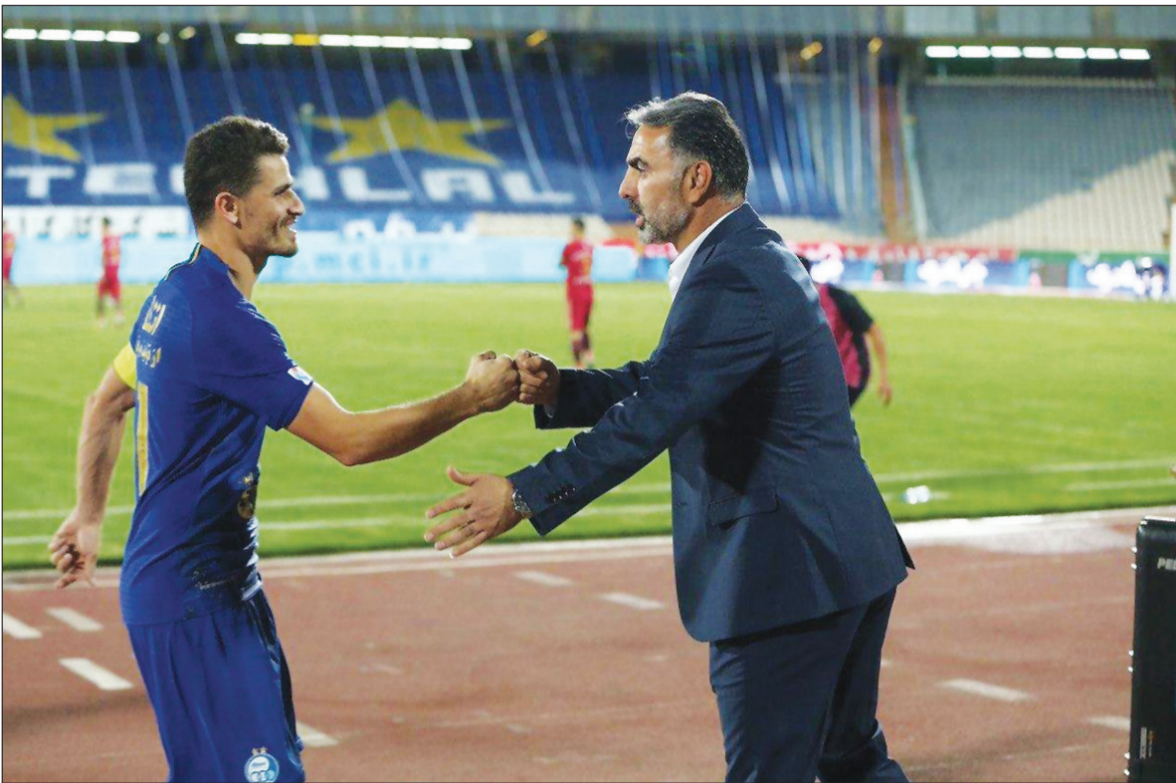
رحمتی و اولین تجربه مر بیگری در لیگ برتر