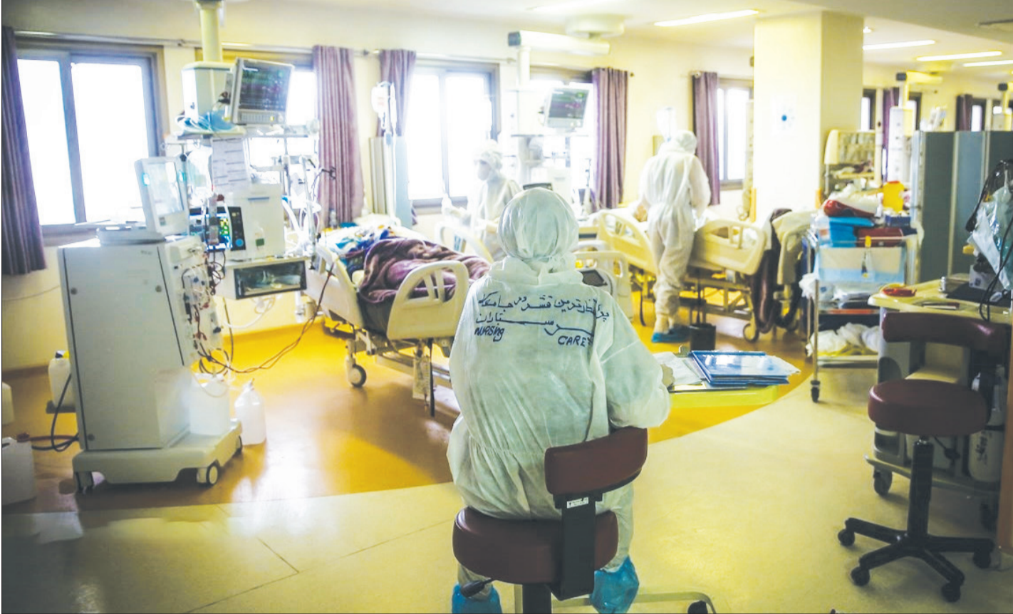
انتقال نشانه روزی پرسنل بیمارستان درصوبهتهنگان برای معالجه بیماران کرونایی