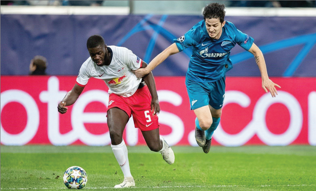
مرحله گروهی لیگ قهرمانان اروپا از امشب آغاز می‌شود