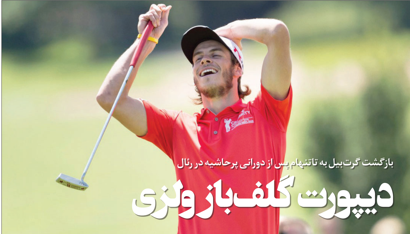
بازگشت گرت بیل به تاتنهام پس از دورانی پرحاشیه در رئال

سستاره ولزی در این فصل فرصت خوبی دارد تا به زیدان ثابت کند درباره او اشتباه کرده است و انگیزه زیادی برای درخشش در ترکیب تاتنهام دارد. تاتنهام که نخستین بازی اش را در فصل جدید با شکست برابر اورتون پشت سر گذاشته است با جدایی کریستین اریکسن در فصل قبل و همچنین برکناری مائوریسیو پوچتینو هنوز نتوانسته با مورینیو به توفیق چندانایی برسد و هواداران این تیم که حدود یک سال پیش حضور در فینال لیگ قهرمانان را تجربه کردند حالا باید امیدوار باشند تا تیم شان در پایان فصل حداقل در کسب سهمیه این تورنمنت موفق باشد. هواداران رئال هم مدت هاست از بیل ناامید شده اند و شاید با رفتن او کمتر کسی از بین آنها حسرت جدایی این وینگر سرعتی را بخورد. بیل که زمانی با حرکت استثنایی اش در ال کلاسیکو و استارتی که در مصاف با بارتزا (مدافع بارسا) زد و با عبور این مدافع جوان او را تحقیر کرد به یاد آورده می شد حالا مدت هاست بین هواداران رئال جایگاهی ندارد. رئالی ها حتی پیش از قطعی شدن انتقال او به تاتنهام پیراهن شماره ۱۱ بیل را به مارکو آسنسیو دادند تا نشان دهند که او دیگر هیچ جایی در برنابو ندارد.