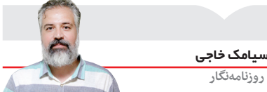
سیامک حاجی روزنامه‌نگار

این روزها و درحالی‌که باشگاه‌های بزرگ فوتبال دنیا با مشکلات مالی زیادی پس از بحران کرونا روبه‌رو هستند، نقل و انتقالات بازیکنان در لیگ ایران با ارقام بعضا عجیبی درحال انجام است. برخلاف روند جهانی که ارزش بازیکنان نسبت به دوران قبل از شیوع کرونا کاهش پیدا کرده است، در لیگ ایران با افزایش چندبرابر قیمت‌ها روبه‌رو هستیم؛ اتفاقی که می‌تواند در آینده نزدیک برای فوتبال ایران و باشگاه‌هایی که اکثرا دولتی هستند، مشکلات زیادی ایجاد کند. روال رایج در باشگاه‌های بزرگ اروپایی درآمدزایی از روش‌های مختلف و انجام هزینه‌ها براساس مجموع این درآمدهاست، اما در فوتبال ایران اوضاع به‌گونه‌ای متفاوت در جریان است و باشگاه‌ها معمولا به بودجه دولتی و همچنین اسپانسرها وابسته هستند و همین موضوع سبب شده تا بودجه مشخصی درطول فصل نداشته باشند.