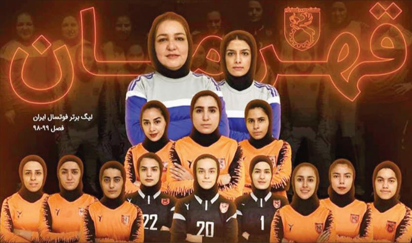
لیگ برتر فوتبال بانوان فصل ۹۸-۹۹

زمانی: لیگ امسال بانوان سطح بالاتری داشت