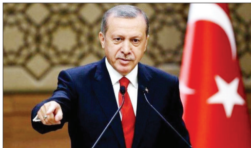
اردوغان: فعالیت در شرق مدیترانه ادامه دارد

مشاور امنیت ملی سابق کاخ سفید در مصاحبه‌ای ضمن ابراز نگرانی در مورد انتخاب مجدد ترامپ و آینده کشورش گفته مردم آمریکا بهتر است برای چهار سال دیگر به وی اعتماد نکنند. به گزارش فارس، جان بولتون در مصاحبه با وبگاه نشنال پرس کلاب ترامپ را فردی توصیف کرد که حتی پیچیدگی‌های دولت آمریکا را درک نمی‌کند. وی در ادامه افزود: «بدتر از این موضوع، آن است که ترامپ هیچ علاقه‌ای به یادگیری نشان نمی‌دهد.» بولتون گفت که رئیس‌جمهور آمریکا مسائل را از بعدی که برایش منفعت داشته باشد، نگاه می‌کند. وی گفت این مسائل تنها محدود به مسائل امنیت ملی نیست، بلکه مسائل داخلی را نیز شامل می‌شود. وی درباره پیروزی ترامپ گفت: «او اشتباهات بسیاری در دور اول ریاست جمهوری خود داشته است و من واقعاً نگران هستم که چه اتفاقی در دور دوم ریاست جمهوری او برای کشور خواهد افتاد.»