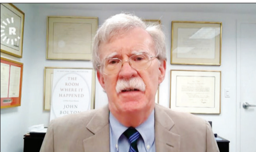
بولتون: دیگر به ترامپ اعتماد نکنید

مشاور امنیت ملی سابق کاخ سفید در مصاحبه‌ای ضمن ابراز نگرانی در مورد انتخاب مجدد ترامپ و آینده کشورش گفته مردم آمریکا بهتر است برای چهار سال دیگر به وی اعتماد نکنند. به گزارش فارس، جان بولتون در مصاحبه با وبگاه نشنال پرس کلاب ترامپ را فردی توصیف کرد که حتی پیچیدگی‌های دولت آمریکا را درک نمی‌کند. وی در ادامه افزود: «بدتر از این موضوع، آن است که ترامپ هیچ علاقه‌ای به یادگیری نشان نمی‌دهد.» بولتون گفت که رئیس‌جمهور آمریکا مسائل را از بعدی که برایش منفعت داشته باشد، نگاه می‌کند. وی گفت این مسائل تنها محدود به مسائل امنیت ملی نیست، بلکه مسائل داخلی را نیز شامل می‌شود. وی درباره پیروزی ترامپ گفت: «او اشتباهات بسیاری در دور اول ریاست جمهوری خود داشته است و من واقعاً نگران هستم که چه اتفاقی در دور دوم ریاست جمهوری او برای کشور خواهد افتاد.»