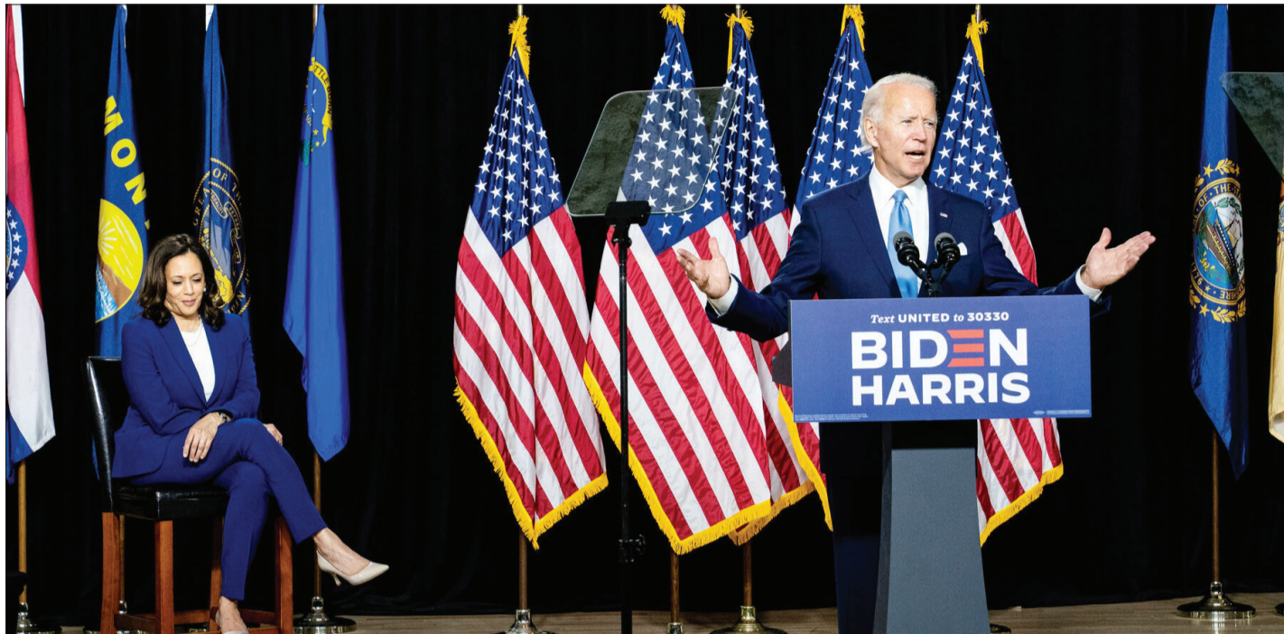
فرهیختگان همه علیه دونالد ترامپ؛ این خروجی دوشنبه از