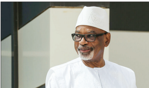
کودتا در مالی و استعفاي رئیس‌جمهور

رئیس‌جمهور لیتوانی از موافقت اتحادیه اروپا با تحریم بلاروس به بهانه تقلب در انتخابات این کشور خبر داد. منابع مطلع بعد از ظهر چهارشنبه اعلام کردند رئیس‌جمهوری لیتوانی دربی شرکت در نشست اتحادیه اروپا گفت که این اتحادیه با تحریم دولت بلاروس موافقت کرده است. بهانه اتحادیه اروپا در تحریم بلاروس ادعای تقلب در انتخابات سراسری در این کشور است. رئیس‌جمهور بلاروس سه‌شنبه شب از استقرار قوای نظامی در مرزهای این کشور با توجه به پاره‌ای ناآرامی‌ها خبر داد. الکساندر لوکاشنکو، رئیس‌جمهور بلاروس گفت که درواکش به اظهارات دولت‌های خارجی درباره وضعیت داخل کشور، بیگان‌های نظامی را در مرزهای غربی بلاروس مستقر کرده است. رئیس‌جمهور بلاروس در سخنرانی‌ای که از تلویزیون دولتی این کشور پخش شد از آمادگی بالای قوای نظامی این کشور و آماده‌باش کامل آنها سخن گفت.