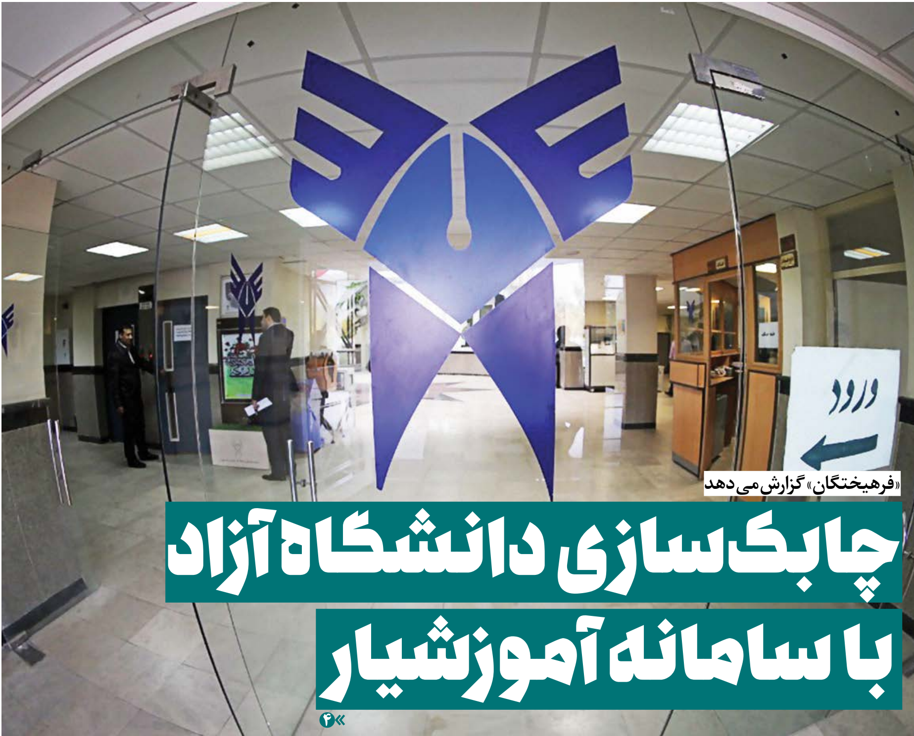
«فرهیختگان» گزارش می دهد