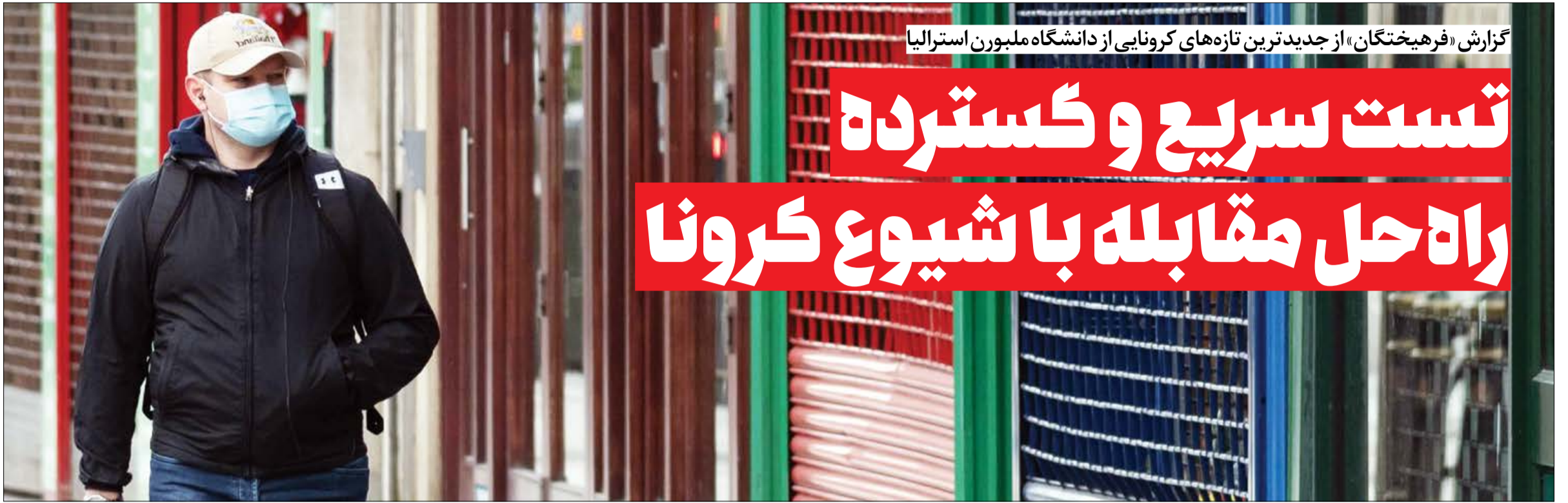
گزارش «فرهیختگان» از جدیدترین تازه‌های کرونایی از دانشگاه ملبورن استرالیا