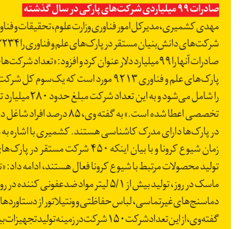
پارک علم و فناوری

صادرات ۹۹ میلیاردی شرکت‌های پارکی در سال گذشته مهدی کشمیری، مدیرکل امور فناوری وزارت علوم، تحقیقات و فناوری میزان فروش سال ۹۸ شرکت‌های دانش‌بنیان مستقر در پارک‌های علم و فناوری را ۱۳۳۴ میلیارد تومان و میزان صادرات آنها را ۹۹ میلیارد دلار عنوان کرد و افزود: «تعداد شرکت‌های دانش‌بنیان مستقر در پارک‌های علم و فناوری ۹۲۱۳ مورد است که یک‌سوم کل شرکت‌های دانش‌بنیان کشور را شامل می‌شود و به این تعداد شرکت مبلغ حدود ۲۸۰ میلیارد تومان اعتبارات عمومی و تخصصی اعطا شده است.» به گفته وی، ۸۵ درصد افراد شاغل در واحدهای فناور مستقر در پارک‌ها دارای مدرک کاشناسی هستند. کشمیری با اشاره به دستاوردهای پارک‌ها در زمان شیوع کرونا و با بیان اینکه ۴۵۰ شرکت مستقر در پارک‌های علم و فناوری در حوزه تولید محصولات مرتبط با شیوع کرونا فعال هستند، ادامه داد: «تولید بیش از یک میلیون ماسک در روز، تولید بیش از ۱/۵ لیتر مواد عفونی‌کننده در روز، کیت‌های تشخیصی، دماسنج‌های غیرتماسی، لباس حفاظتی و ونتیلیاتور از دستاوردهای این شرکت‌هاست.» به گفته وی، از این تعداد شرکت ۱۵۰ شرکت در زمینه تولید تجهیزات بیمارستانی فعال هستند.