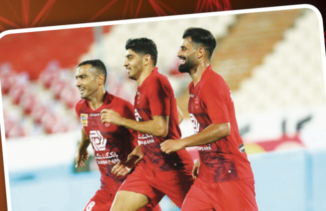
پیروزی تراکتور با حاج صفی، شکست سنگین ذوب آهن با بوناچیچ