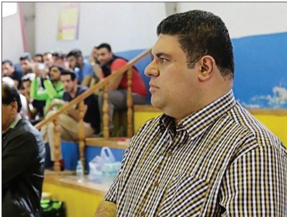
وحد سلیمانی روزنامه‌نگار

دیدار مرحله رفت فینال لیگ برتر فوتسال بعد از مدت‌ها تعطیلی به دلیل ویروس کرونا بالاخره در اصفهان کلید خورد، آن هم بدون تماشاگر؛ دیداری که با برد نماینده تبریز همراه بود و مسی‌ها را به جام قهرمانی نزدیک‌تر کرد. خبر خوشحال کننده دیگر برای اهالی فوتسال احتمال تیم‌داری استقلال و پرسپولیس در لیگ برتر فوتسال است.