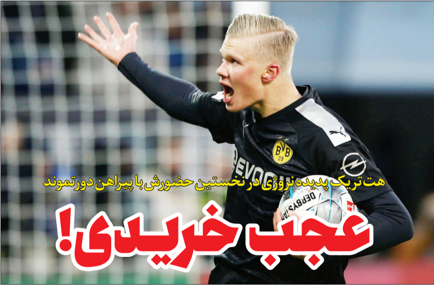
هت‌تریک پدیده نروژی در نخستین حضورش با پیراهن دورتموند! عجب خریدی!

مارکوریوس، کاپیتان دورتموند درباره اینکه آیا این ستاره جوان می‌تواند جانشین اوبامیانگ شود، می‌گوید: «فکر می‌کنم آخرین بازیکنی که چنین درخششی داشت، اوبامیانگ بود و حالا هالند یک بار دیگر این نمایش را تکرار کرده است. او می‌تواند چنین داستانی را در دورتموند تکرار کند و جای خالی پیر را پر کند. هالند عملکرد بسیار خوبی در این دیدار داشت و شروعی با ما عالی بود.»