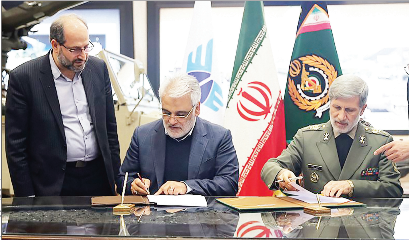
عناصیر: روابط عمومی دانشگاه آزاد

به گزارش روابط عمومی دانشگاه آزاد اسلامی، دکتر