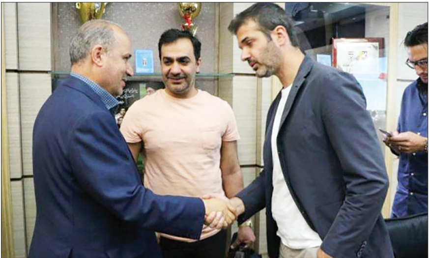
معاون ورزشی به باشگاه ارجاع بدهم.

گفته می‌شد او از رسانه‌ای شدن رسید پولش هم ناراحت شده است.