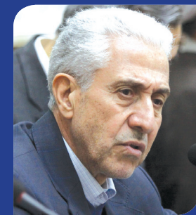
شیوهنامه انضباطی ۹۸ در دانشگاهها اجرا نمی شود