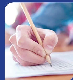
تهدید مهلت ثبت نام آزمون کارشناسی ارشد ناپیوسته

۴ معاون پژوهشی و فناوری واحدهای بزرگ دانشگاه آزاد اسلامی استان تهران در گفت و گو با «فرهیختگان»: