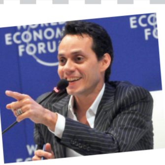
مارکو آنتونیو مونیز که با نام مارک آنتونی شناخته می‌شود، خواننده، آهنگساز و بازیگر پورتو ریکویی-آمریکایی است که همواره از او به‌عنوان یکی از بهترین خوانندگان سبک سال‌سازم برده می‌دود. آنتونی دوبار با مشکلات مالیاتی مواجه شد. یکبار در سال ۲۰۰۷ محکوم به پرداخت ۲۵ میلیون دلار مالیات به نیویورک و یک‌بار هم در سال ۲۰۱۰ محکوم به پرداخت جریمه مالیاتی ۳/۵ میلیون دلاری شد.