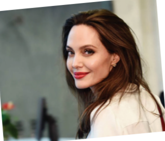
فعالیت‌های اجتماعی هنرمندان هالیوود یکی دیگر از روش‌هایی است که آنها را از پرداخت مالیات معاف می‌کند. آنجیلینا جولی از سال ۲۰۰۶ از سوئی کمبریای عالی سازمان ملل متحد در امور پناهندگان، به‌عنوان سفیر حضانت بچه‌ها به جولی فرزند پسرپدیده‌اش داشت، ضمن اینکه حضانت بچه‌ها توسط جولی، خنثی‌کننده مالیات هم بود. البته حقوق اورگان و پناهندگان مشغول است.

قصه زندگی و ازدواج دوبارینگر مشهور هالیوود «آنجلینا جولی» و «برد پیت» در رسانه‌های جهان تبدیل به یکی از افسانه‌های قرن جدید شده بود. فضاسازی که بعد از مدت کوتاهی با جدایی این دو بازیگر سروشکل دیگری به خود گرفت. آنجلینا جولی در دوران زندگی با پیت صاحب ۶ فرزند شد که سه نفر از آنها را به سرپرستی گرفت و سه نفر دیگر حاصل ازدواج او با نفر بودند. آنجیلینا جولی پس از طلاق و بعد از جنجال‌هایی که به پا شد از جمله شکایت برای بازداشت همسر سابقش برد پیت، ظاهرابه این توافق رسیدند که بچه‌ها به صورت دائم تحت سرپرستی متحد در امور پناهندگان، به‌عنوان سفیر حضانت بچه‌ها به جولی فرزند پسرپدیده‌اش داشت، ضمن اینکه حضانت بچه‌ها توسط جولی، خنثی‌کننده مالیات هم بود. البته