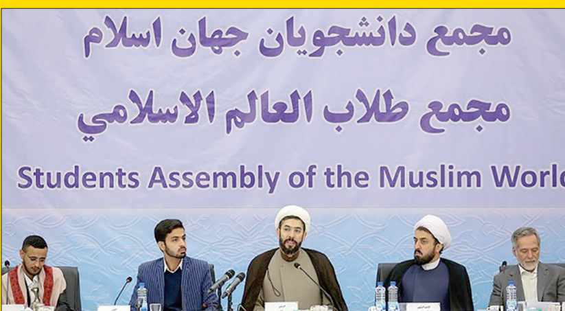
مجمع دانشجویان جهان اسلام مجمع طلاب العالم الاسلامی Students Assembly of the Muslim World